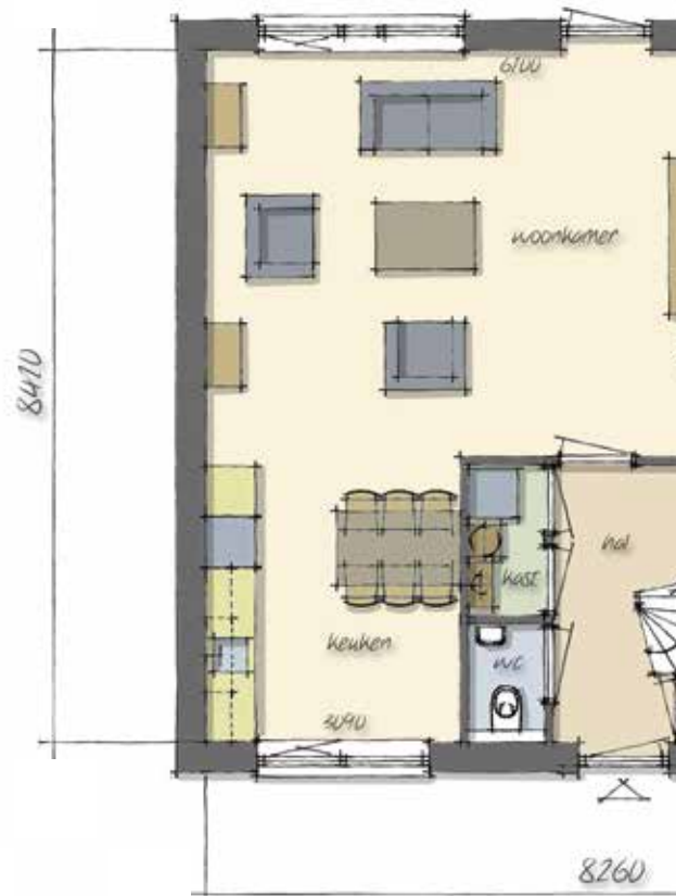
BEGANE GROND (opt)