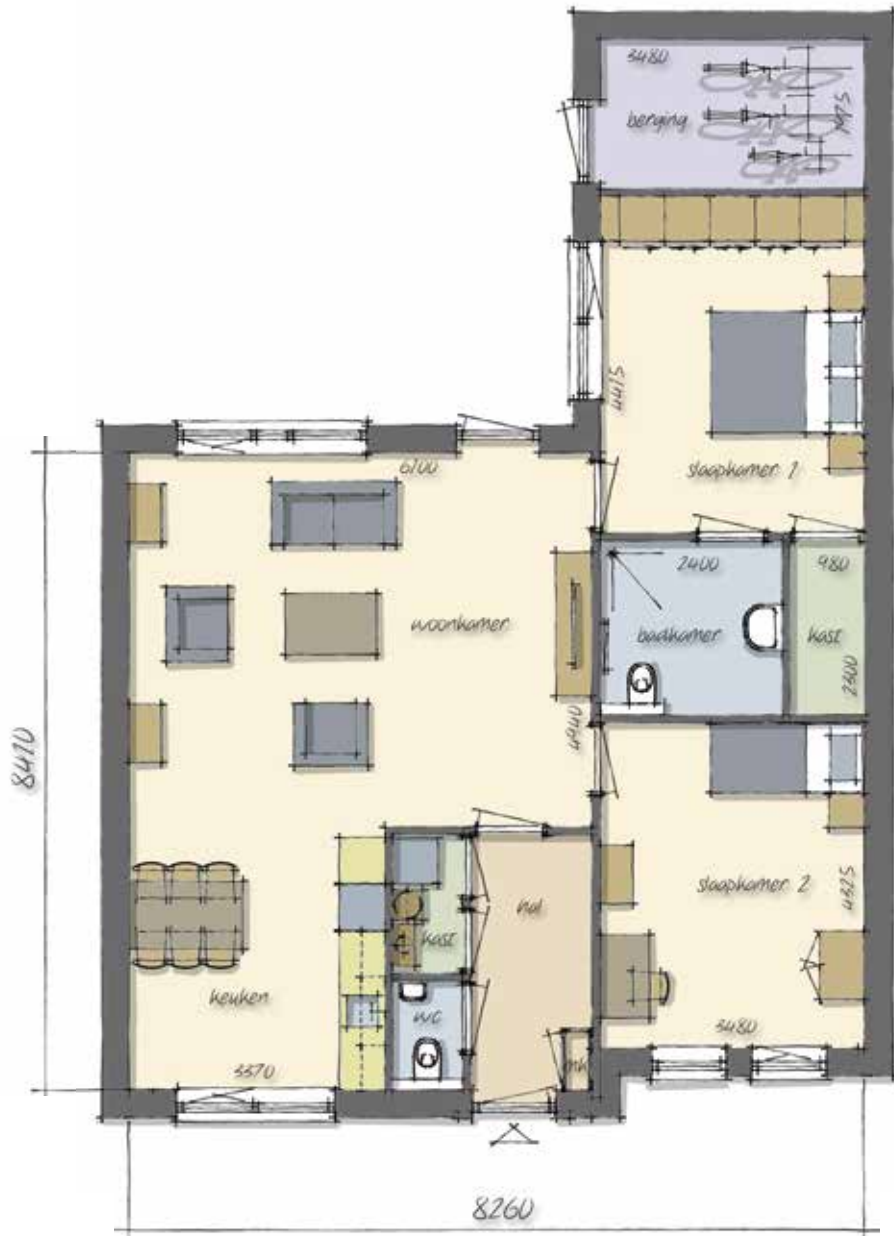
BEGANE GROND (vrijstaand)